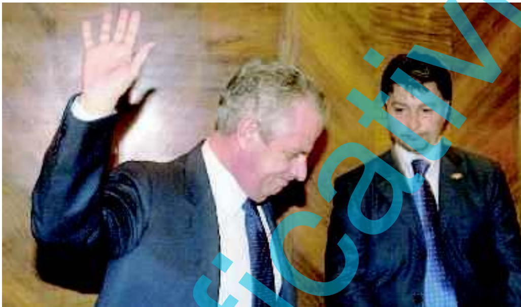
Il ministro Scajola lascia la conferenza stampa dopo aver annunciato le sue dimissioni

ROMA — Claudio Scajola si dimette «per consentire al governo di andare avanti». Coinvolto nel caso dell'appartamento acquistato, secondo le accuse, con soldi di uno degli imprenditori dell'inchiesta sul G8, l'esponente del Pdl abbandona per la seconda volta nella sua vita la poltrona di ministro. Mentre a Roma si apre un'altra inchiesta su Verdini, Berlusconi dice che si «è dimesso un ministro molto capace» e che «in Italia c'è fin troppa libertà di stampa». E Bersani: «L'esecutivo è tra palude e precipizio».