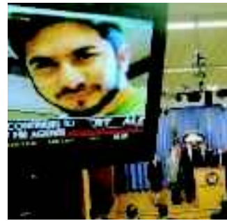
In tv la foto di Faisal Shahzad