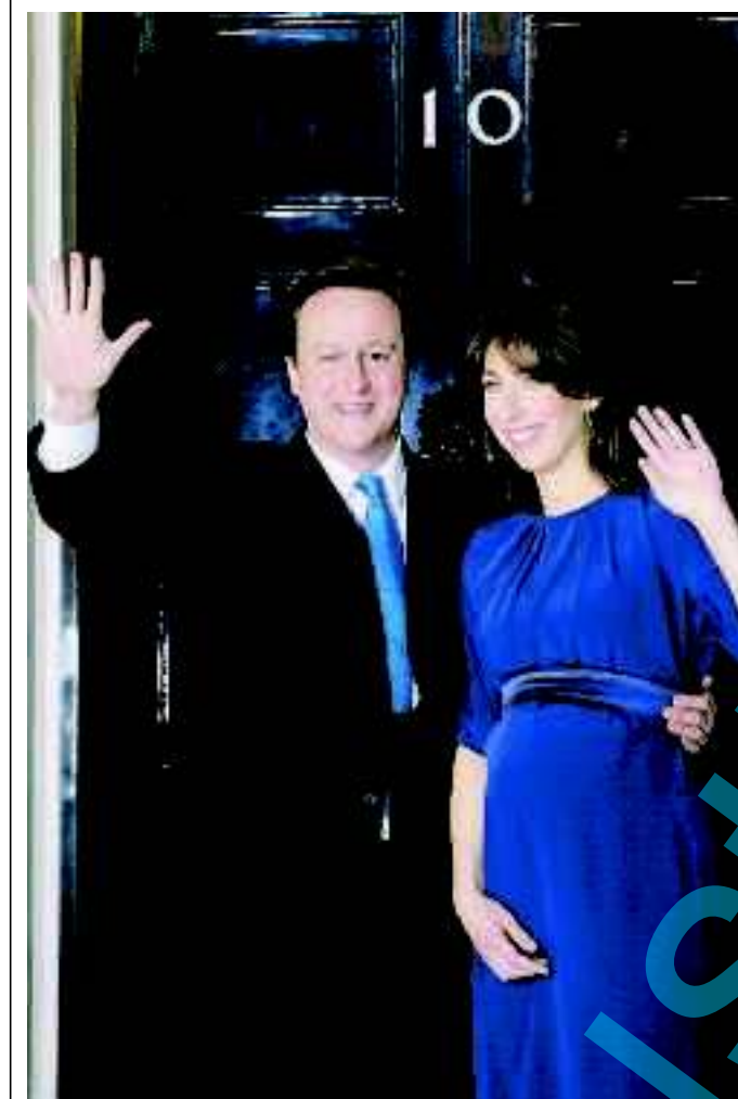
Cameron con la moglie FRANCESCHINI ALLE PAGINE 2 E 3

Via libera dalla regina, governo con i lib-dem di Clegg Brown si dimette Cameron a Downing Street