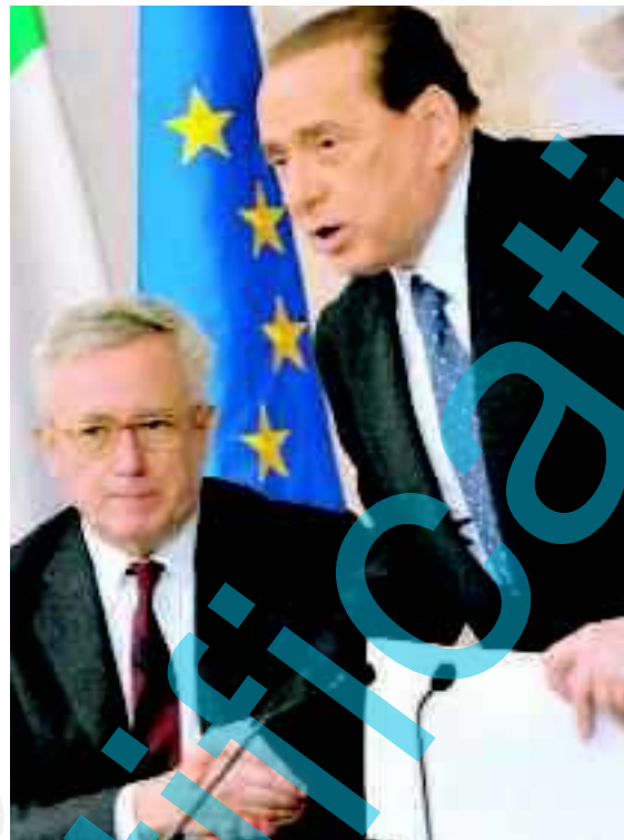
Silvio Berlusconi e Giulio Tremonti

ROMA — Scontro nel governo tra Berlusconi e Tremonti sulla manovra economica varata solo con riserva. Le misure principali sono: condono edilizio, blocco degli stipendi pubblici e stretta sulle pensioni. Stangata su regioni e comuni.